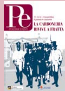
in copertina immagine di fondo

Largo Europa 2 - Porto Tolle Tel. 0426 247276 - Fax 0426 380584 - 81150 iat@prolocoportotolle.org